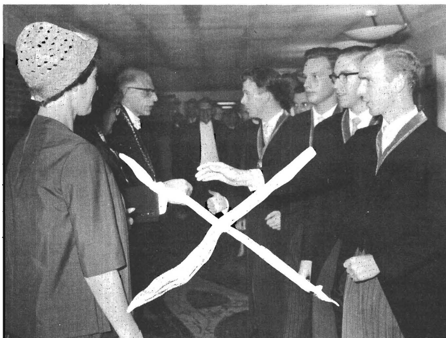
Zo was het...; maar nu niet meer