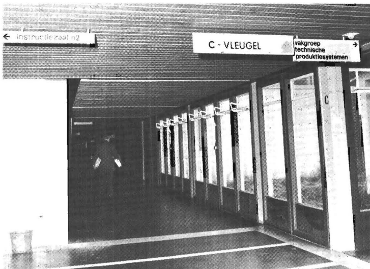
Binnen-bewegwijzering in paviljoen.