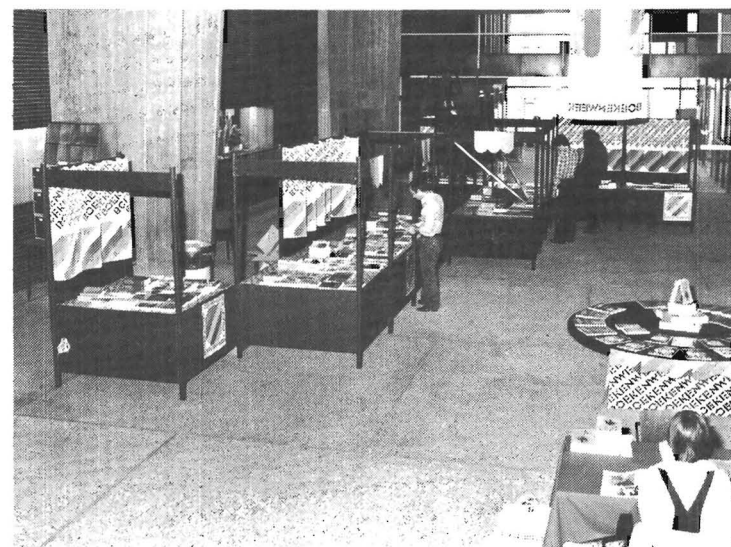
In de hal van het hoofdgebouw zijn in het kader van de boekenweek 1979 weer een aantal boekenstalletjes ingericht. Gaat men de trap op dan is daar de tentoonstelling 'Boek als beeldend middel' te vinden.