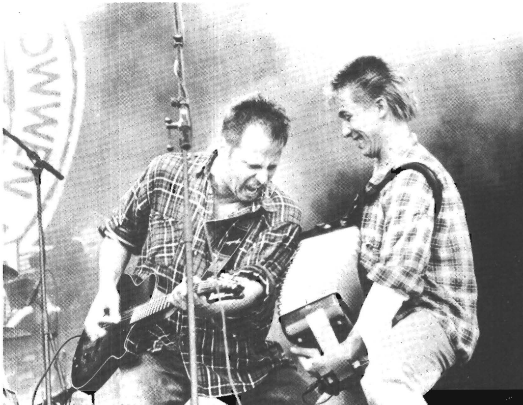
Foto: Pinkpop '92.

Het eerste grote studentenfeest van Eindhoven vindt dit jaar al plaats in week 2. Op 16 september viert Industria, studievereniging van technische bedrijfskunde, namelijk haar 6e lustrum met een spetterend feest in 't Karregat. Zo'n 1900 feestgangers worden vanaf half negen verwacht. Speciale gast is de band Rowwen Hèze, die vanaf 21.45 uur zal optreden. Rowwen Hèze was tot voor kort het best bewaarde geheim van Limburg maar is nu met de cd 'Station America' en de single 'Rowwen Hèze' doorgedrongen tot ver boven de rivieren. Hun eerste grote hit was 'Bestel mar'. Ze waren de verrassing van Pinkpop '92 waar ze de tienduizenden bezoekers aan het swingen kregen. Tex mex, polka en folk zijn de ingrediënten die Rowwen Hèze tot de ultieme feestband maken. Voor en na het optreden van de Limburgers kan iedereen swingen op de muziek van de drive-in, die laat op de avond onderbroken wordt door een flitsende act van maar liefst zes dansers. Kaartjes zijn voor fl. 12,50 te koop bij het VVV, Industria en de verkoopposten op de TUE en het HBO.